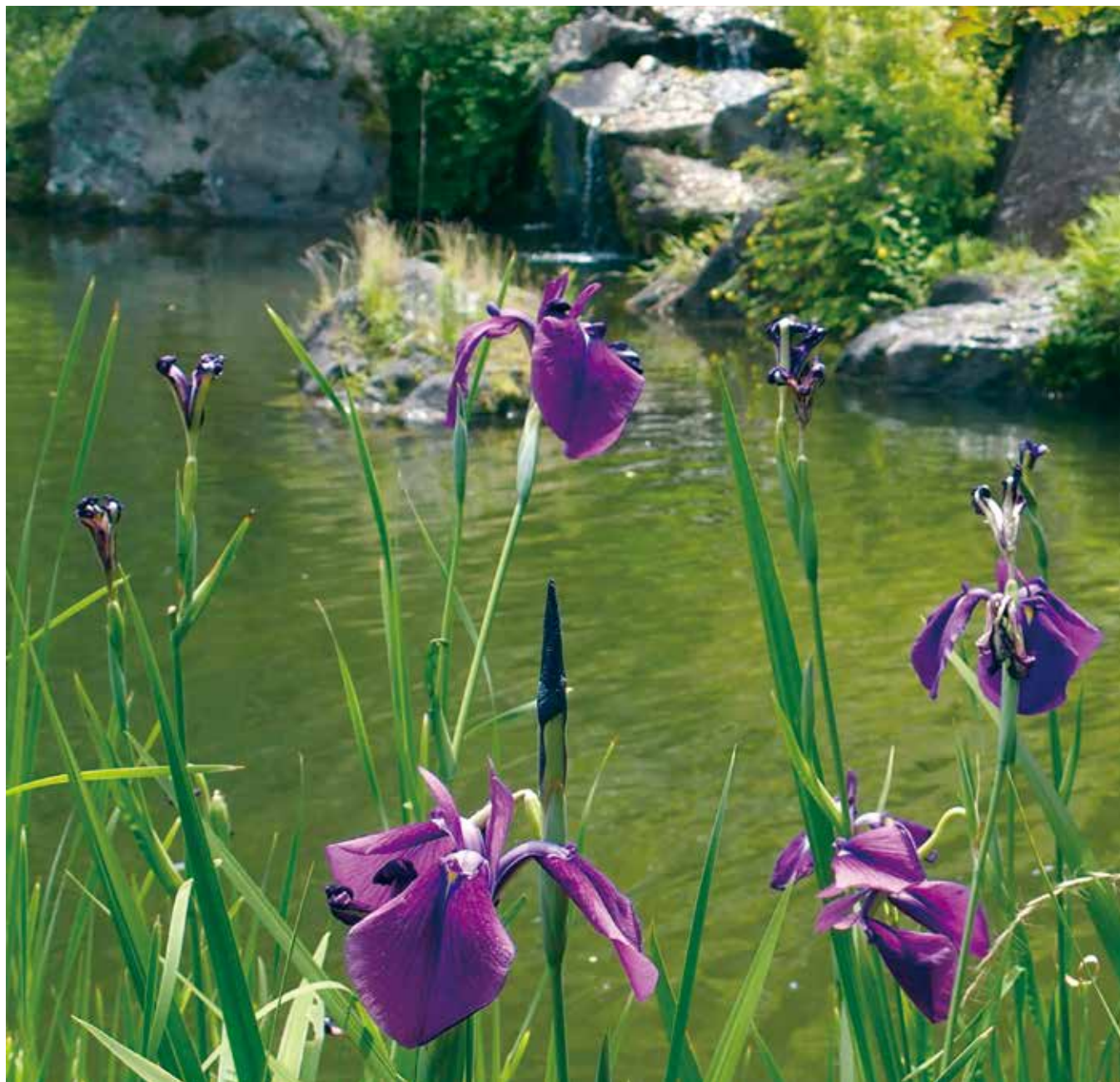
成田山公園にて「初夏に涼む竜智の池」