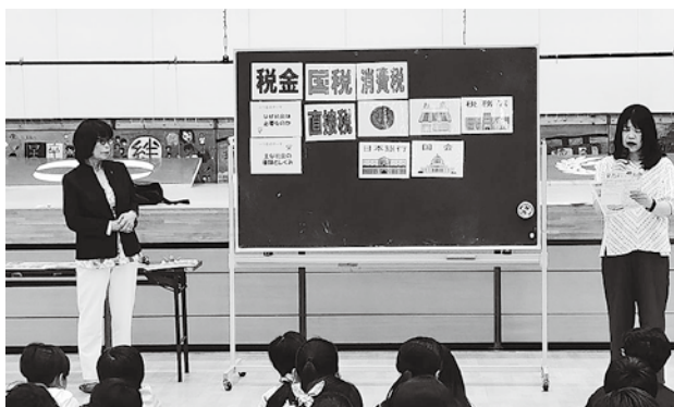
6月23日の八街市立実住小学校での様子

6月22日(月)一般社団法人千葉県法人会連合会の役員大会が、千葉市中央区のオークラ千葉ホテルにおいて開催された。