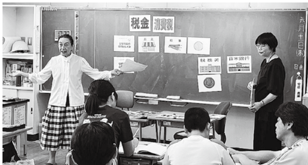
6月11日の佐倉市立和田小学校での様子