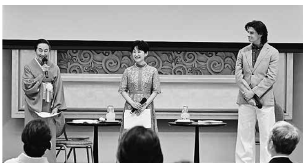
講演会（対談）の様子