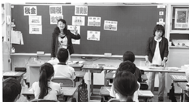
6月16日の成田高校付属小学校での様子