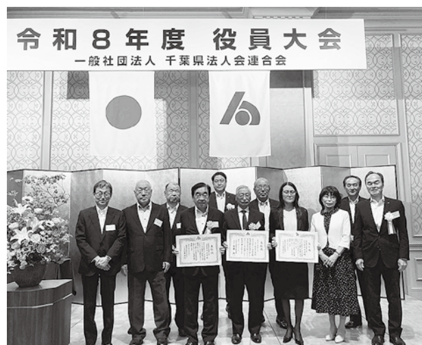
成田法人会の出席者

大会後には懇親会が着座方式にて開催され、受賞された方々へのお祝いや1年ぶりに再会した各法人会の仲間との交流など、和やかな雰囲気にも包まれた。