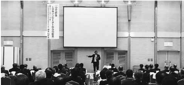
講演会の会場の様子