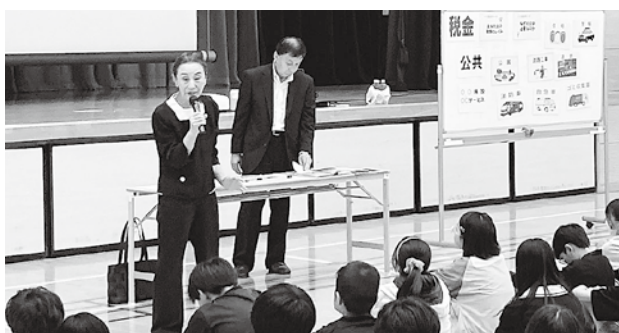
6月17日の佐倉市立西志津小学校での様子