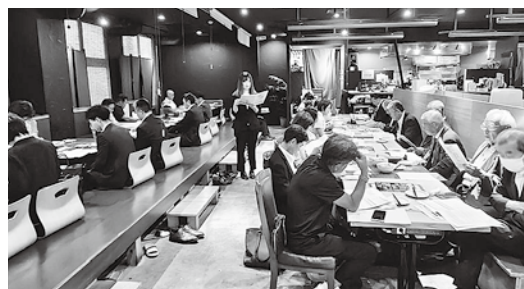
6月26日 四街道ブロック