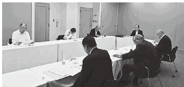
会長・副会長会議の様子