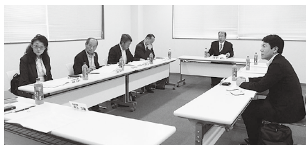
税制委員会の様子

中小企業の活性化に資する税制措置、事業承継税制の拡充、消費税制度への対応、役員給与の損金算入の拡充、租税教育の重要性等を、令和9年度税制改正に関する提言(案)として県法連に提出することとなった。