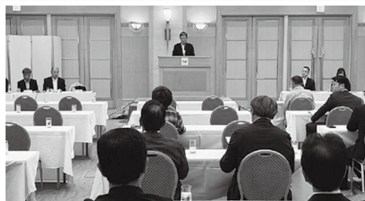
6月8日 佐倉ブロック