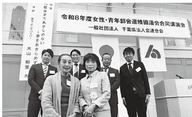
成田法人会の出席者

そして、講演会終了後、青年部会連絡協議会・女性部会連絡協議会の合同交流会が着座形式で開催され、他の法人会の部会役員との親睦を深める機会となった。