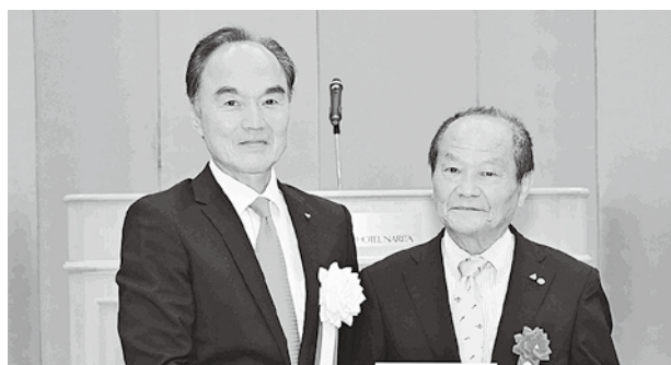
会員増強 個人表彰の様子