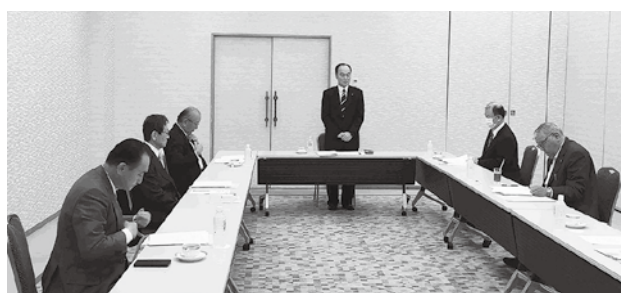
会長・副会長会議の様子