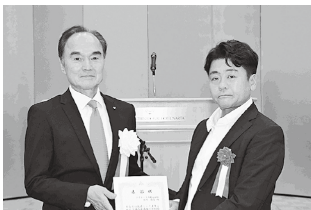
役員功労表彰の様子