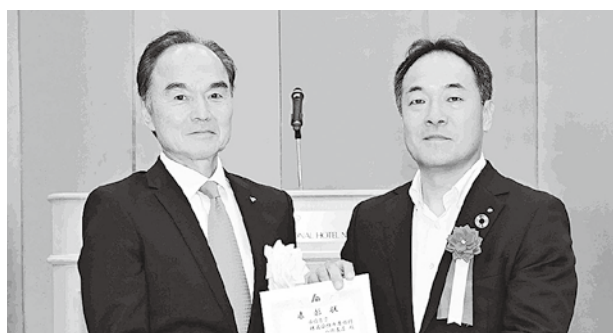
会員増強 銀行表彰の様子