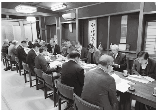
組織委員会の様子