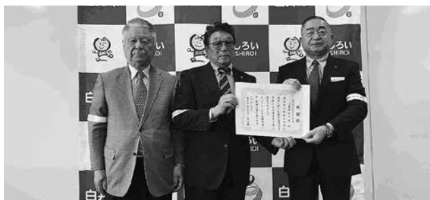
白井市での寄贈式の様子

白井支部では、令和4年7月に白井市内の小学校に通学する小学生に対し3,600個を寄贈し、今回で4回目となる本事業は、令和7年4月に1年生となる小学生の安全な登下校に役立てていただけるよう寄贈したものであり、白井市から法人会に対し感謝状が贈られた。