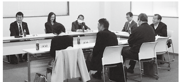
研修・厚生委員会の様子

また令和7年度より対応が必要となった全法連による「健康経営プロジェクト」については、厚生委員会に青年部会OBを2名ほど入れて、健康経営プロジェクトメンバーとして活動してもらうことが確認された。