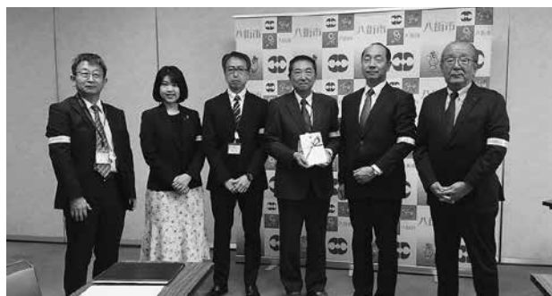
八街市での寄贈式の様子

八街支部では、令和4年3月に八街市内の中学校に通学する中学生に対し1,750個を寄贈したが、前年度に続き4回目となる今回は、令和7年4月に1年生となる中学生の安全な登下校に役立てていただけるよう寄贈したものであり、八街市から法人会に対し感謝状が贈られた。