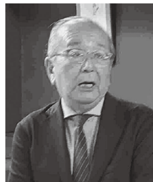
海寶組織委員長の挨拶