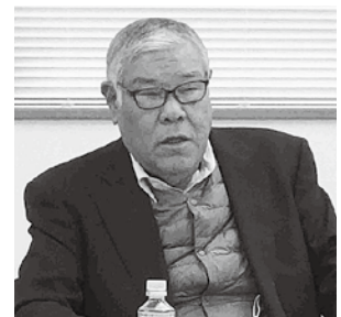
飯塚地域社会貢献委員長