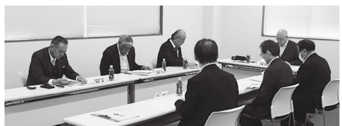
総務委員会の様子