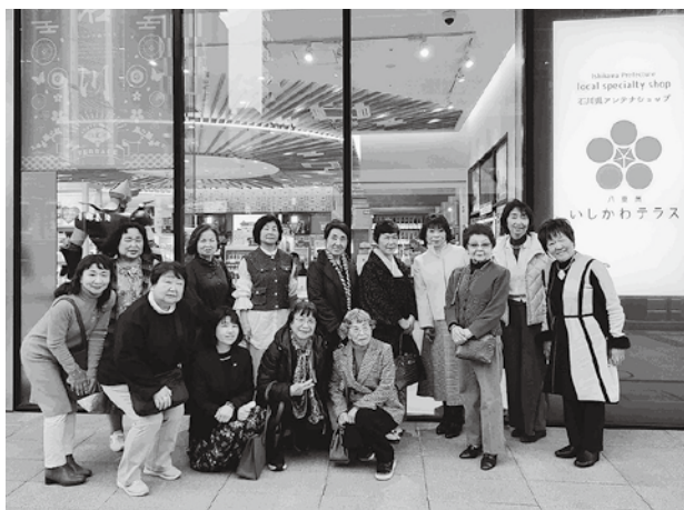
石川テラス前にて

観劇の後は、能登の物産を応援しに東京駅八重洲口にある「八重洲いしかわテラス」(石川県アンテナショップ)に立ち寄った。