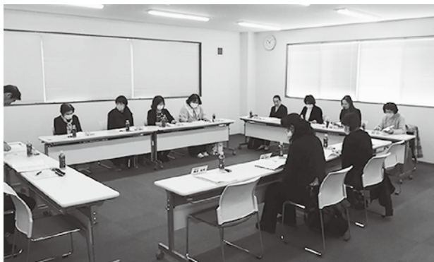
女性部会役員会の様子