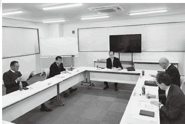
会長・副会長会議

また1月23日の社団化50周年記念講演会、式典、祝賀会について、当日の役割や担当等が再確認された。