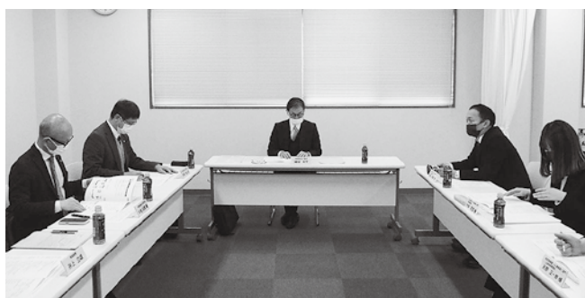
研修委員会（三者調整会議）の様子