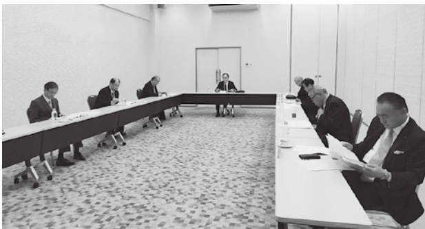
会長・副会長会議の様子