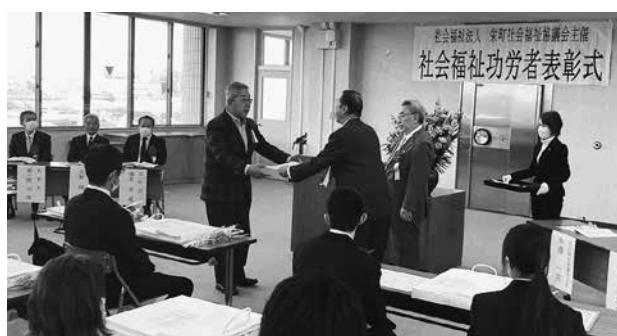
栄町社会福祉協議会での表彰式の様子