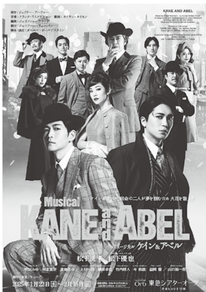
「ケイン&アベル」のポスター