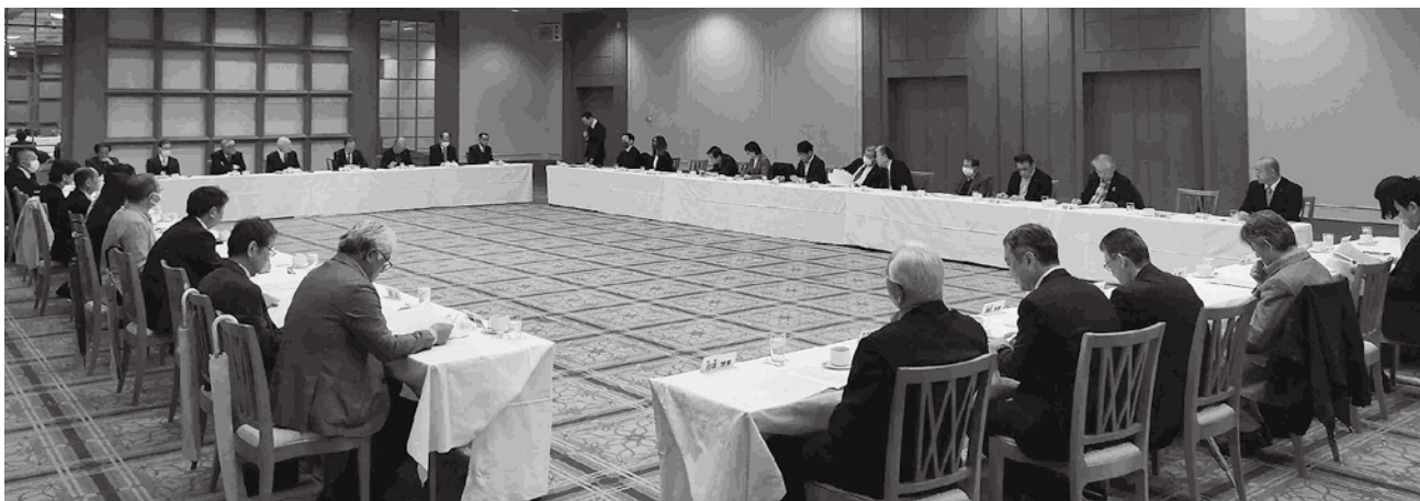
第3回理事会の様子

第3議題の「支部・ブロックの統合」については、令和7年4月1日付で志津北支部と志津南支部を統合して「志津支部」とし、同時に佐倉ブロックと志津ブロックも統合して「佐倉ブロック」とするもので、満場一致で承認された。また、第4議題の「令和7年度事業計画(案)の件」及び第5議題の「令和7年度収支予算(案)の件」、第6議題の「第52回定時総会次第及び付議事項(案)の件」についても原案どおり承認された。