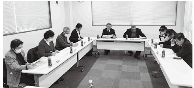
広報・地域社会貢献委員会の様子

令和7年度についても、白井市や八街市等の産業まつりといった地域行事への参画および支部が主体となった地域社会への貢献事業、持続可能な社会の実現に向けた地域のさまざまな取り組み（SDGs）への後援・協賛を行うことが審議された。