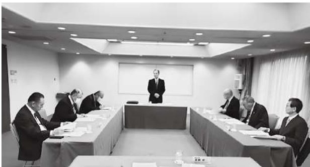
会長・副会長会議の様子

また第51回定時総会はマロウドインターナショナルホテル成田で開催され、総会終了後には4年ぶりに意見交換会が開催されることとなった。