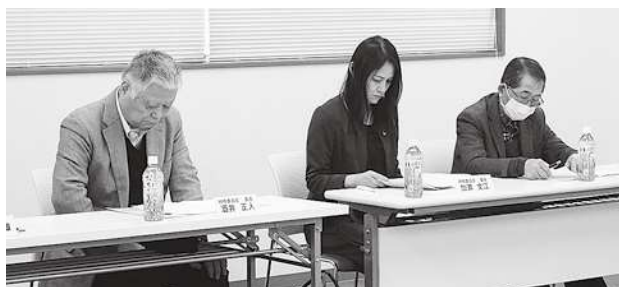
研修・厚生委員会の様子