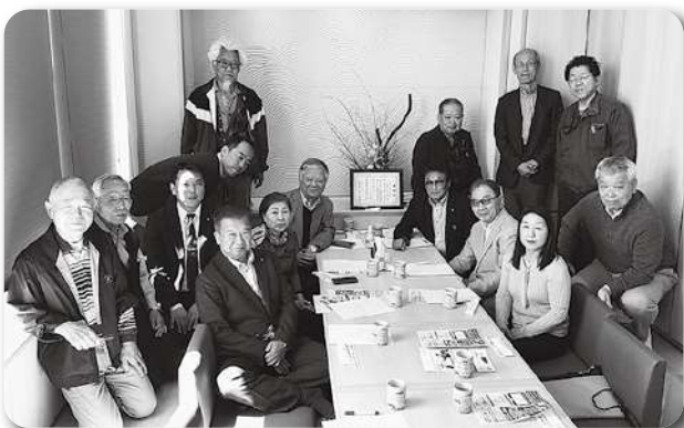
臼井支部情報交換会 (4/10)