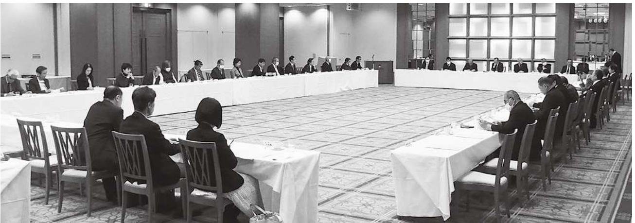
第3回理事会の様子

社団化50周年事業については、記念祝賀会や地域社会貢献事業、税を考える週間における街頭キャンペーン等が計画された。