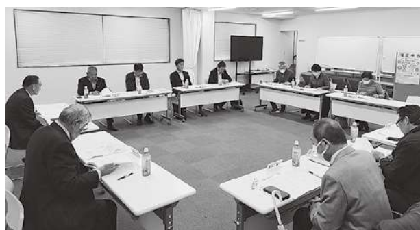
広報・地域社会貢献委員会の様子