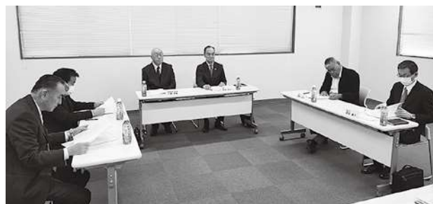
総務委員会の様子