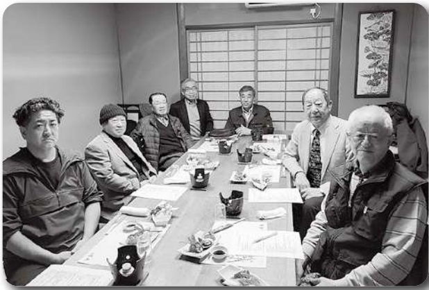
成田西支部役員会 (3/1)