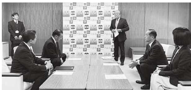
八街市での寄贈式の様子

八街支部では、令和4年3月に八街市内の中学校に通学する中学生に対し1,750個を寄贈したが、前年度に続き3回目となる今回は、令和6年4月に1年生となる中学生の安全な登下校に役立てていただけるよう寄贈したものであり、八街市から法人会に対し感謝状が贈られた。