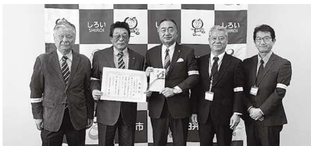
白井市での寄贈式の様子

白井支部では、令和4年7月に白井市内の小学校に通学する小学生に対し3,600個を寄贈したが、前年度に続き3回目となる今回は令和6年4月に1年生となる小学生の安全な登下校に役立てていただけるよう寄贈したものであり、白井市から法人会に対し感謝状が贈られた。