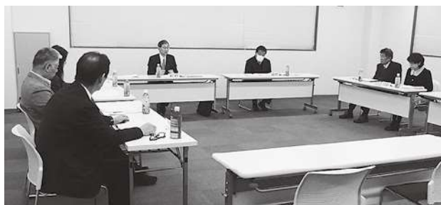
研修・厚生委員会の様子