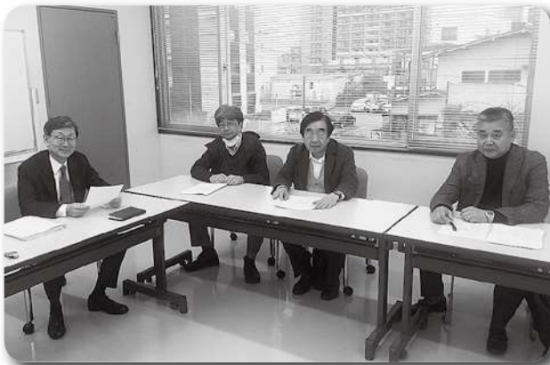
佐倉ブロック支部長会議 (4/5)