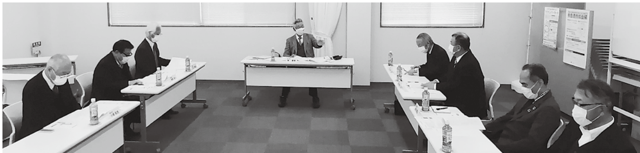
会長・副会長会議の様子