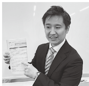
大西法人審理担当

なお、今回の「決算法人説明会」には、成田ケーブルテレビの取材が入り、研修会の様子を収録した。