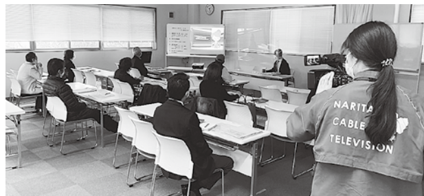
ケーブルテレビの研修会取材

ては、受講者定員10名を原則とし、飛沫防止のためのアクリルボードの設置、入室前の検温や換気、受講中のマスク着用等の感染予防対策を図るなか開催している。