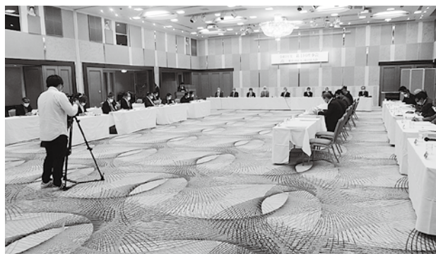
成田ケーブルテレビ取材の様子