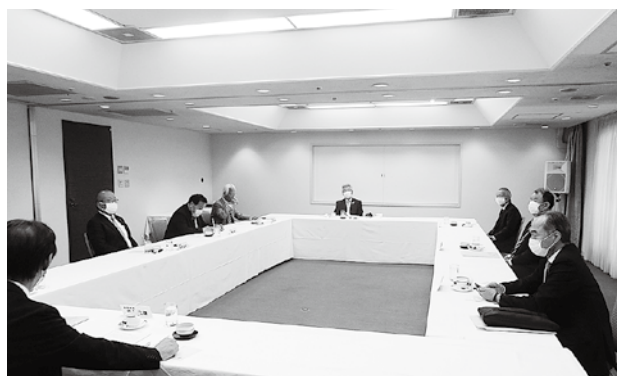
会長・副会長会議の様子

会長・副会長会議においては、今後のスケジュールの確認や、総会や全国大会への対応について話し合いが行われた。