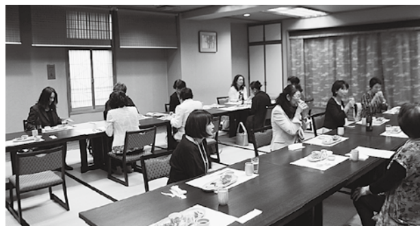
ソーシャルディスタンスをとった席次