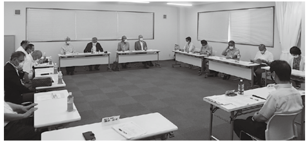
地域社会貢献委員会の様子

日(金)、会場は久能カントリー倶楽部とし、寄付の対象先や金額、チャリティーゴルフ大会参加募集等の詳細については、9月8日開催予定の第2回理事会で審議することとなった。