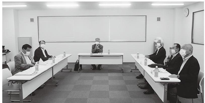
会長・副会長会議の様子