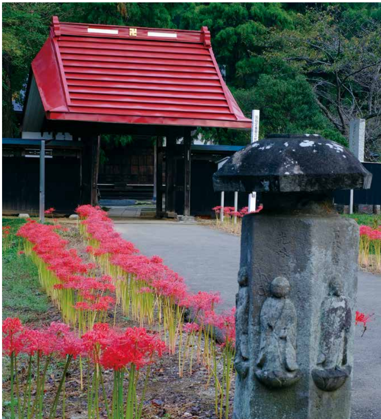
撮影場所：印西市 結縁寺 銅像不動明王像