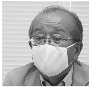
海賓地域社会貢献委員長